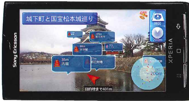
街歩きナビゲーションサービス